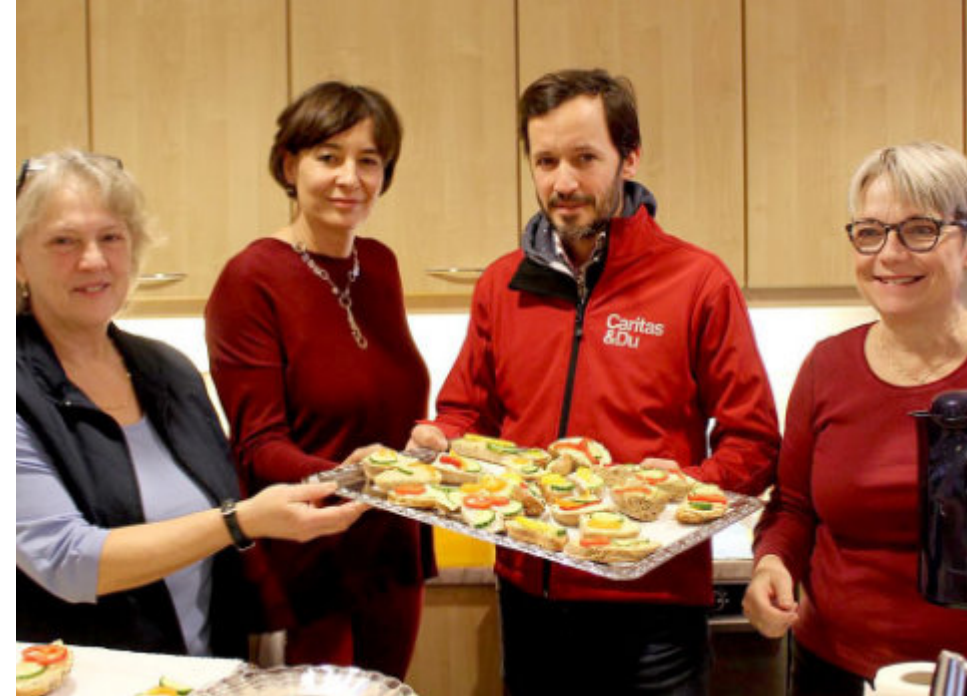
Platz für alle mit besonderem Flair: jeden Freitag ist jetzt ein reges Treiben im Pfarrsaal (hinter der Pfarrkirche Lainz) zu erleben... Viele Hände sorgen dafür.

lichst viele Seiten dieser Zeitung lesen... gerne auch mit einem kritischen Auge! Immerhin wird sie ja an alle Haushalte unseres Pfarrgebiets verteilt und das sind circa 14.000. Also viel Vergnügen beim Lesen! Gerne auch ein Feedback an: pfarre@amlainzerbach.at