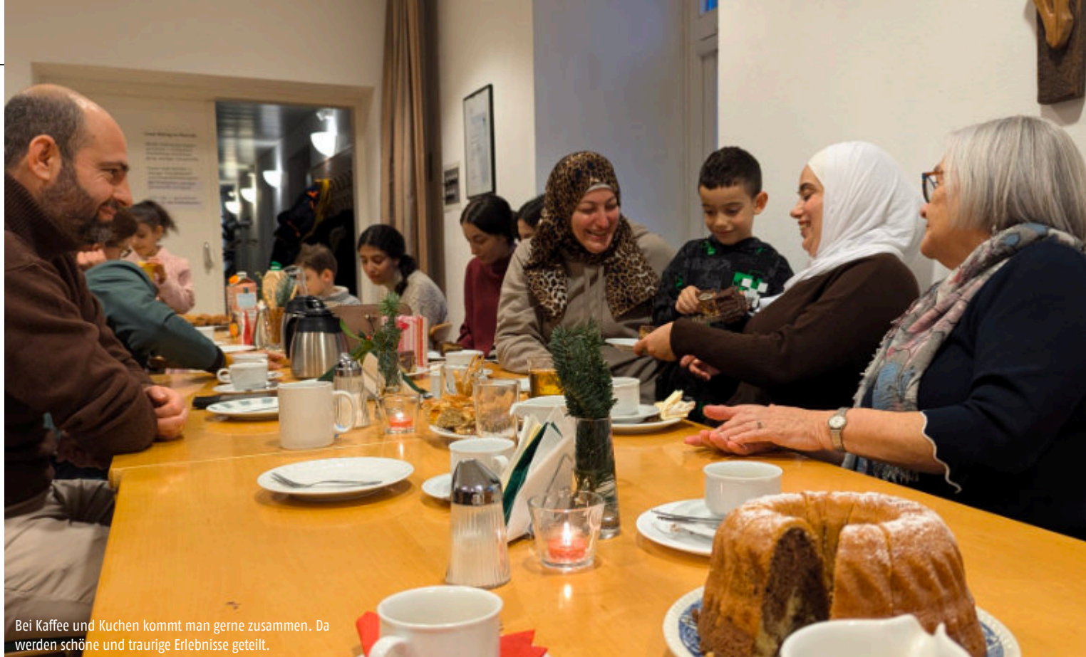
Bei Kaffee und Kuchen kommt man gerne zusammen. Da werden schöne und traurige Erlebnisse geteilt.