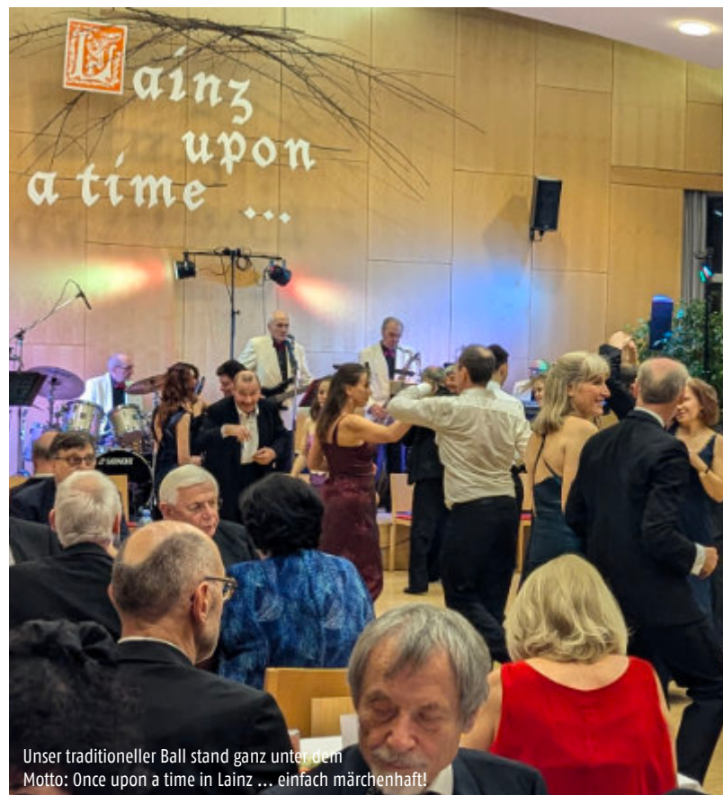
Unser traditioneller Ball stand ganz unter dem Motto: Once upon a time in Lainz ... einfach märchenhaft!

Natürlich sind die wirklich schönen Momente in einem Pfarrleben nicht mit dem Fotoapparat festzuhalten. Die bleiben eh immer in unserer Erinnerung. Zugleich aber wollen wir mit dieser Bildauswahl ein wenig Lust machen frei nach dem Motte „Schau'n Sie sich das an!“