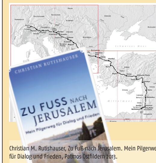
Christian M. Rutishauser, Zu Fuß nach Jerusalem. Mein Pilgerweg für Dialog und Frieden, Patmos Ostfildern 2013.

war ein Abenteuer, das all unsere Kräfte forderte. Dass und wie es sich realisierte, war aber ein grosses Geschenk. In den kleinen wie in den schwierigsten Situationen – wir pilgerten durch das Syrien, in dem gerade der Krieg ausgebrochen war – erlebte ich Gottes Führung. Hätte ich nicht an Wunder geglaubt, das Pilgern hätte es mich gelehrt.