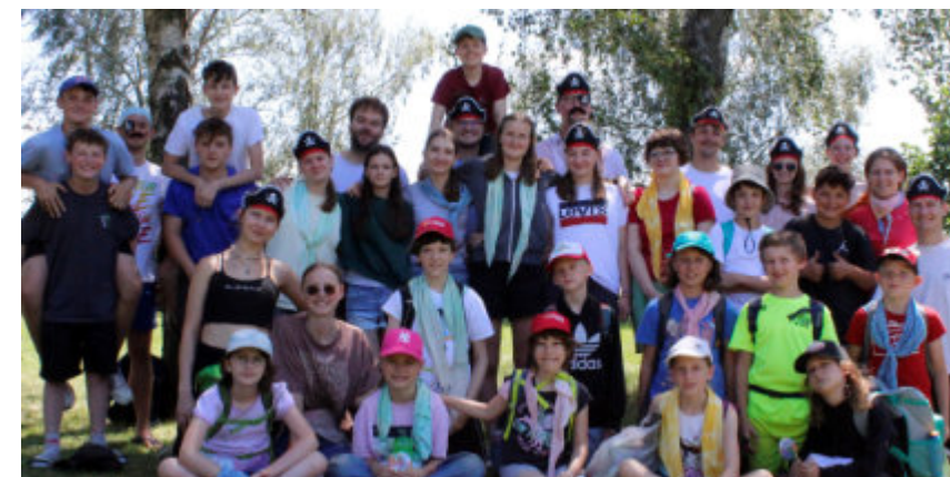
Auch in der Jung-schar selbst könnt Ihr gerne jederzeit zum Schnuppern vorbei schauen. Immer Freitags von 17-19 Uhr in der Stein-lechnergasse 16.