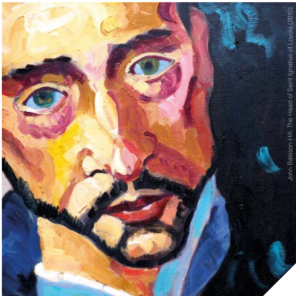
John Bateson-Hill, The Head of Saint Ignatius of Loyola (2010)